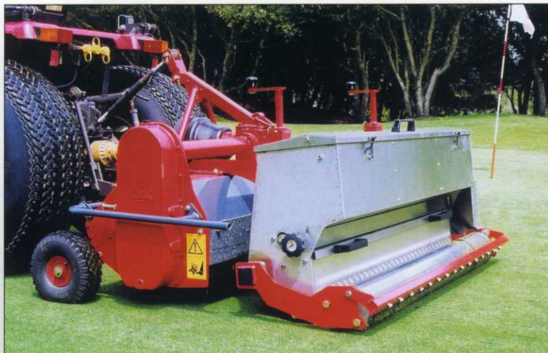
Rigeneratrice seminatrice CR 140