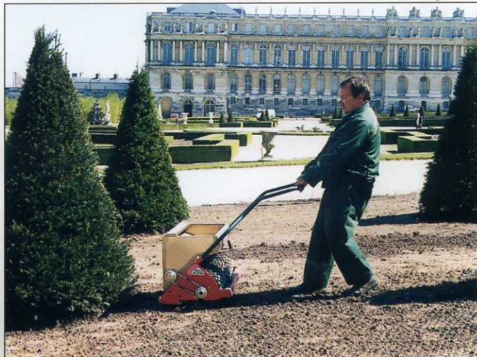
Semina in piccoli spazi con la Seedy