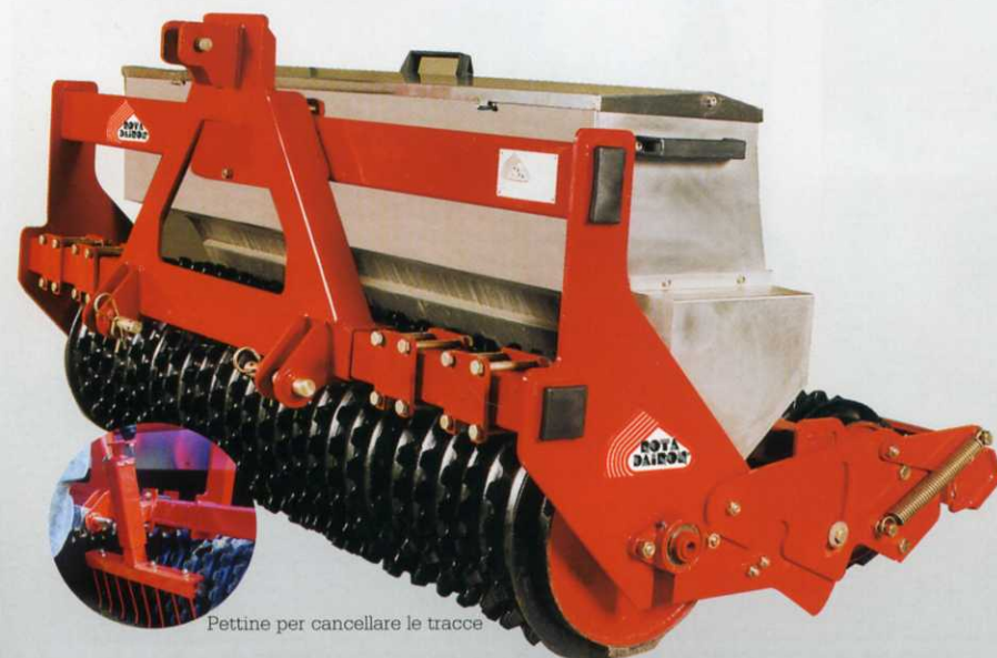
Pettine per cancellare le tracce