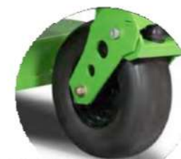
RUOTE ANTERIORI ANTI FORATURA o MICHELIN X TWEELS® (di serie)