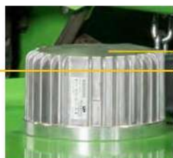
MOTORE SENZA CARBONIO