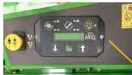
QUADRO DI CONTROLLO