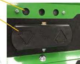
LED ROTORI CONTROLLO RAPIDO DI ALTEZZA