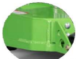
PIATTO ALLUMINIO REGOLABILE ELETTRICO