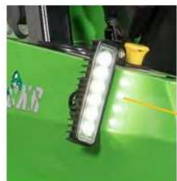
ILLUMINAZIONE A LED (Opzionale)