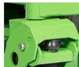
SOSPENSIONE ANTERIORE (Opzionale)