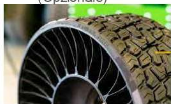
RUOTE POSTERIORI SENZA ARIA MICHELIN X TWEELS® (opzione) o RUOTE PER PRATO