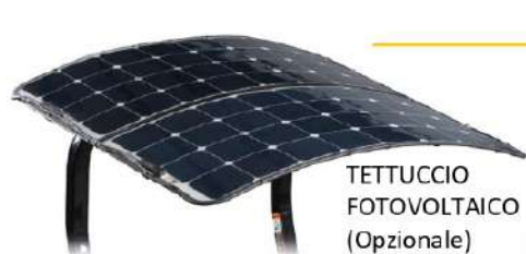
TETTUCCIO FOTOVOLTAICO (Opzionale)