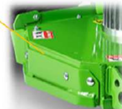
TELAIO E PIATTO ALLUMINIO