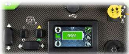
CRUSCOTTO SCHERMO TOUCH SCREEN