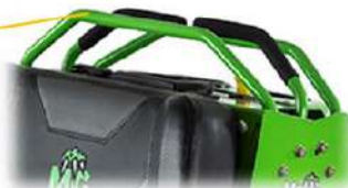
LEVE DI GUIDA DI PRECISIONE