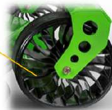
RUOTE ANTERIORI MICHELIN® X-TWEEL®