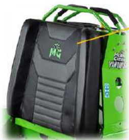
CUSCINO DI APPOGGIO OPERATOR