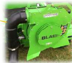
SOFFIATORE REGOLABILE (Opzionale)