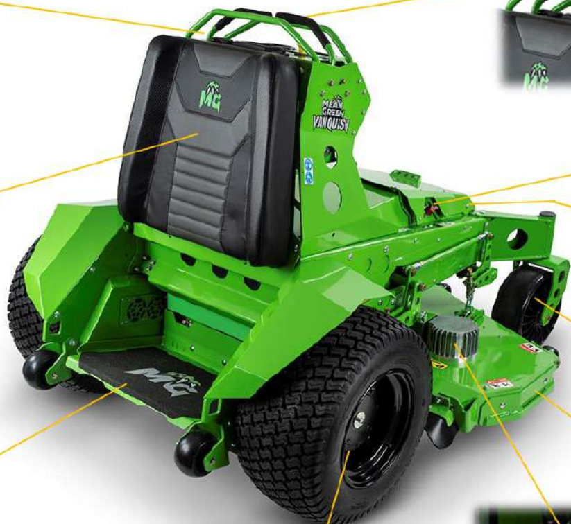
TRANSMISSIONE DA MOTORI ELETTRICI REDUTTORI PLANETARI